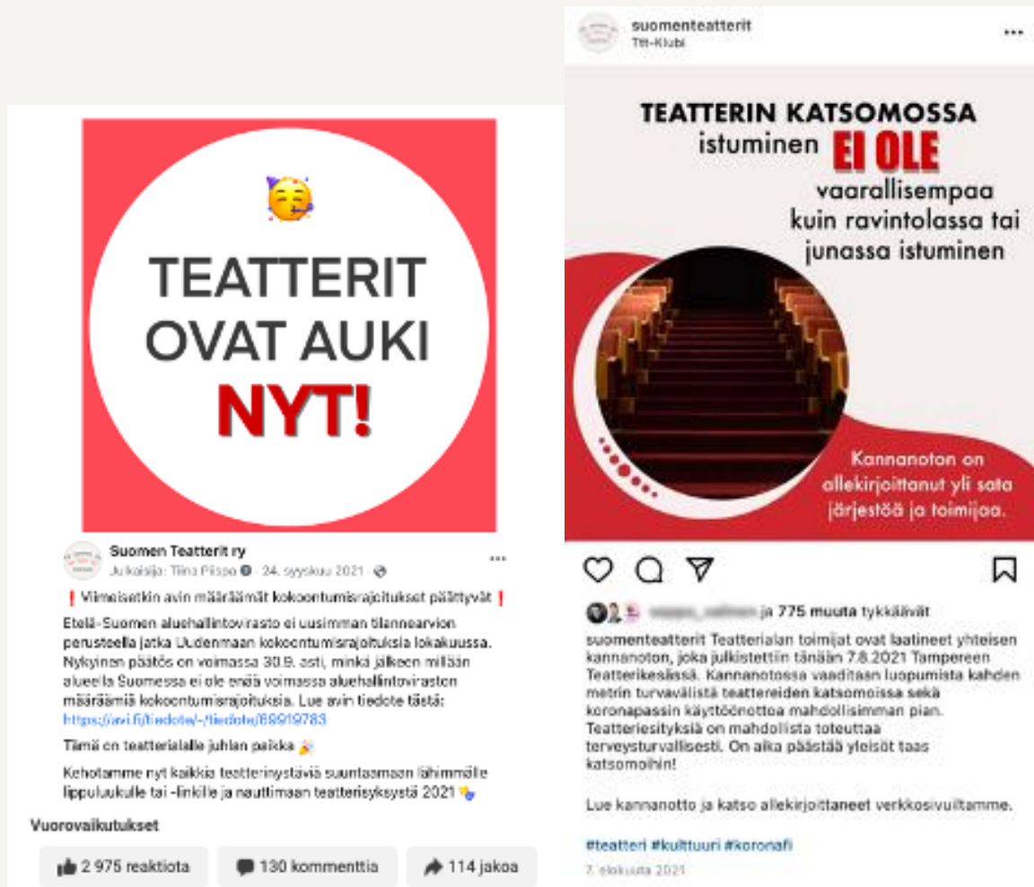
Kuvat 2 ja 3: Suosituimmat some-julkaisut Facebookissa ja Instagramissa

Twitterissä julkaistiin enimmäkseen järjestön omia uutisia ja yhteisiä kampanjaviestejä sekä ajankohtaisia uutisia esittävän taiteen alalta. Seuraajia STEFI:n tilillä oli vuoden 2021 lopussa 1 015 (vrt. 789 vuoden 2020 lopussa). Vuoden 2021 suosituin twiitti liittyen kahden metrin turvaväleihin julkaistiin 12.8. ja se sai yhteensä 11 008 näyttökertaa.