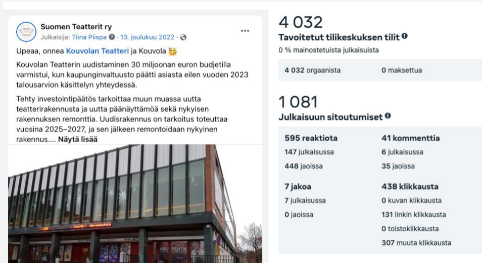
Kuva 2: Suosituin julkaisu Facebookissa

Instagramissa kattavuus oli vuonna 2022 5 511, mikä on vähemmän kuin vuonna 2021 Instagramin osalta kattavuus tarkoittaa niiden yksittäisten tilien määrää, jotka näkivät minkä tahansa tilin julkaisun tai tarinan vähintään kerran. Seuraajia tilillä oli vuoden 2022 lopussa yhteensä 2 261 (vrt. 2 141 seuraajaa joulukuussa 2021).